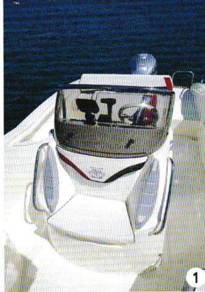
1 – L'assise devant la console comporte des ailes enveloppantes et des poignées de maintien.

Dans la partie arrière, on trouve plusieurs volumes de rangements. L'assise du leaning post s'ouvre en grand pour, par exemple, recevoir du matériel de sécurité, dont les gilets souvent un peu encombrants. L'assise de la banquette arrière se soulève avec un vérin, mais le coussin gêne un peu et il faut défaire les pressions. Dans les pavois, des vide-poches, qui pourraient gagner en profondeur, seront bien utiles. Dans le passage sur bâbord vers la plage arrière et son échelle de bain, qui possède une belle rampe pour aider à la sortie de l'eau, la douche en option vient se ranger dans une petite trappe. Les finitions sont correctes pour un bateau qui cherche avant tout à être accessible en terme de tarif. Ce Jaguar 6.0 peut donner un petit coup de griffe à la concurrence.